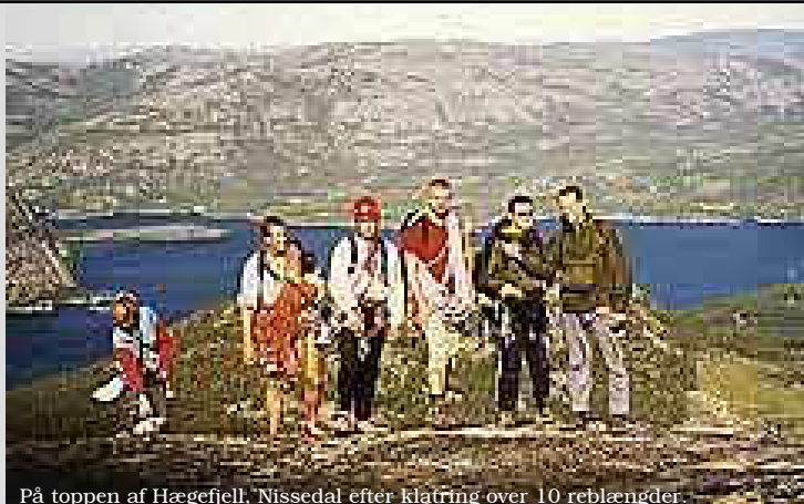
På toppen af Hægefjell, Nissedal efter klatring over 10 reblængder.

Du er velkommen til at kontakte os, hvis du har spørgsmål mm. Jeg ser frem til at høre fra dig.